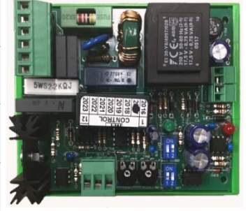
VKK 04 Kontrol Kartı ( Control Circuit )