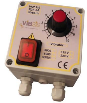
VKK 110 Kontrol Pano ( Control Box )